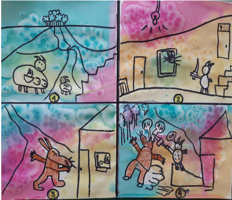
Technique du dessin à l'encre et au gros sel

Une chèvre s'en va avec ses gros tétons remplis de lait Manger de la bonne herbe fraîche. Avant de fermer sa porte à clés, Elle dit à son enfant : « N'ouvre surtout pas cette porte, sauf si je te dis ce mot de passe, Méfie-toi du loup et de sa famille ! »