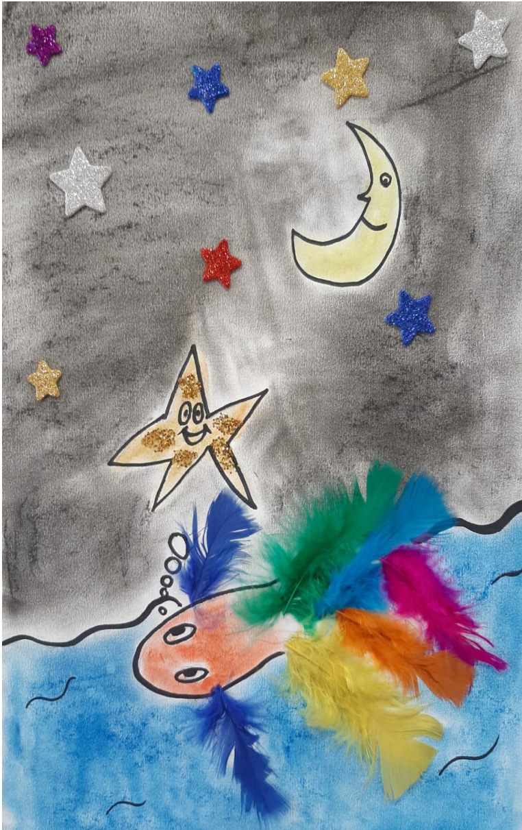
Technique du collage de plumes, de paillettes et coloriage aux pastels secs

Là-haut dans l'espace, au-dessus des nuages, L'étoile scintillante ne peut voir son visage. Là-bas dans l'abîme habite un poisson plume Qui écrit de jolis vers et regarde la lune.