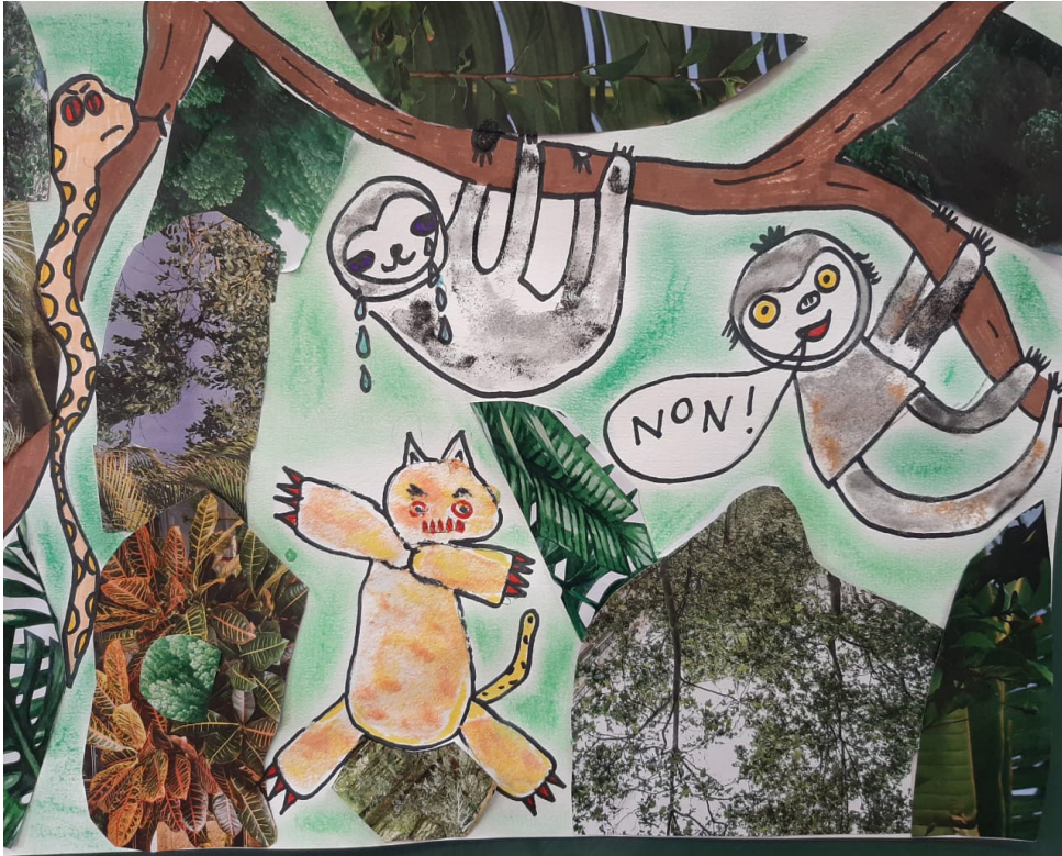
Technique du découpage / collage de papiers magazines et de sables colorés

À l'école de la forêt Un mouton paresseux nommé Drey Se faisait agresser sans arrêt Par le jaguar Willy et l'anaconda Audrey.