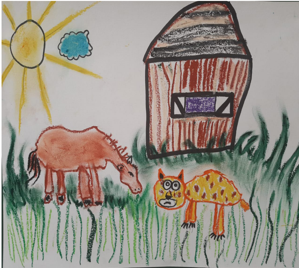
Technique du pastel gras

Le cheval broute tranquillement L'herbe devant sa maison. Le jaguar s'approche tout doucement ; Il a de mauvaises intentions.